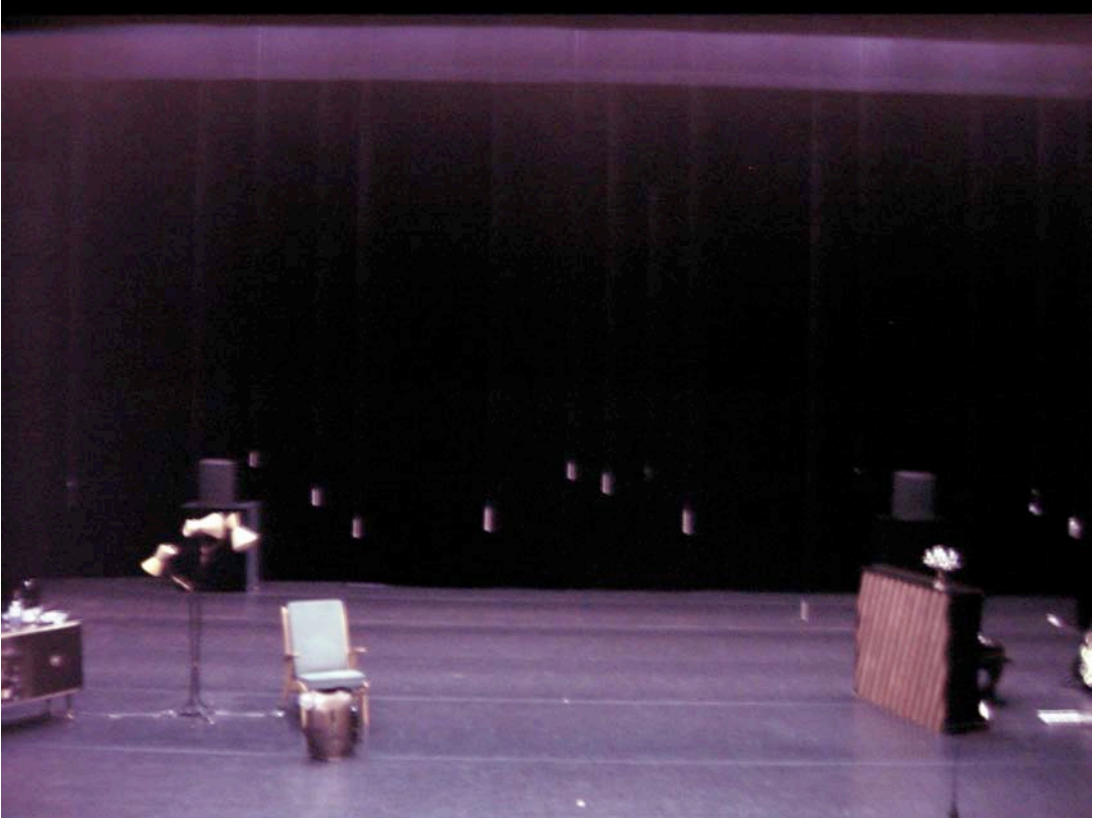
1 : photo du plateau